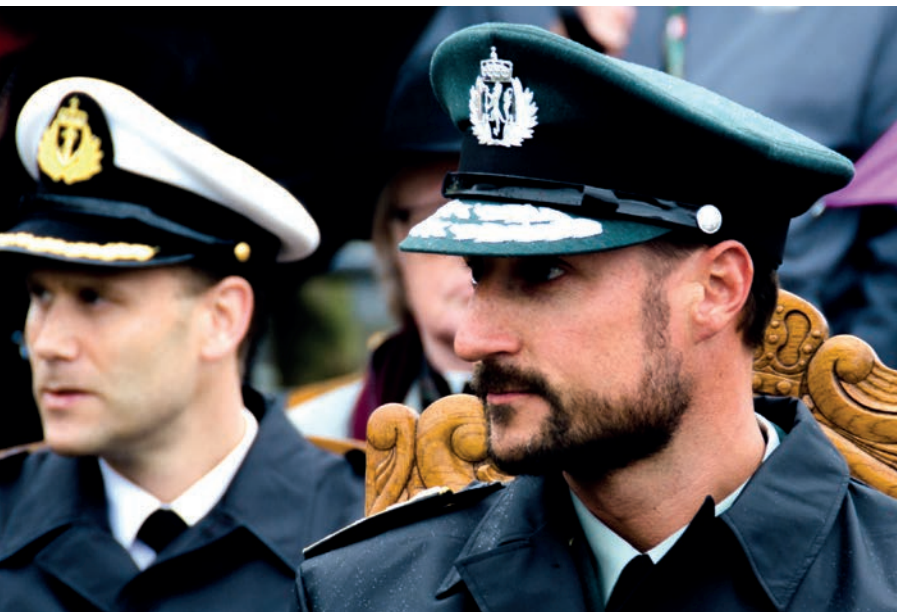
H.K.H. Kronprinsregenten var til stede ved 75-årsmarkeringen under markeringen av kampen om Narvik 28. mai 2015.