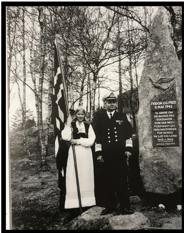
*Minnemarkering Uskedalen 1995