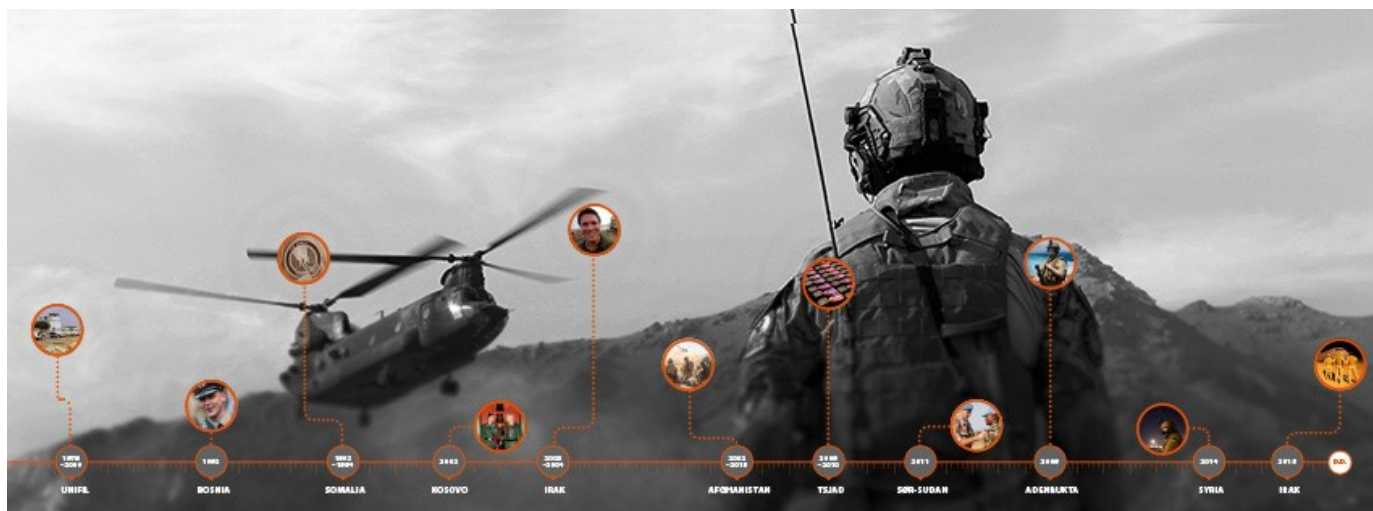
Illustrasjon: Forsvarets Veterantjeneste

Helt siden andre verdenskrig var over og Tysklandsbrigaden ble opprettet i 1946 har norske soldater reist ut i verden for å bidra med fredsbevarende arbeid.