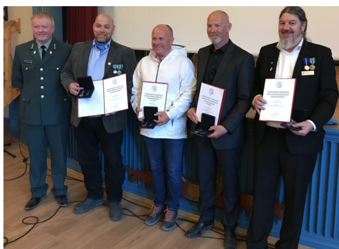
Intops medaljeutdeling av hv område sjef i Hallingdal.

En veteranplan skal først og fremst være: En anerkjennelse av den enkelte veteran med familie , for den innsatsen og de offer som er gjort for at vi i dag kan leve i et trygt, stabilt og fredelig Norge.