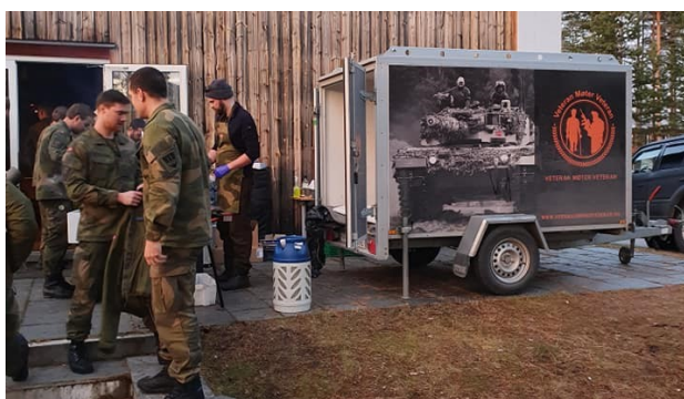
Veteran møter veteran har grilling på Rena

Direkte kontakt: info@veteranmoterveteran.no tlf: 90088866