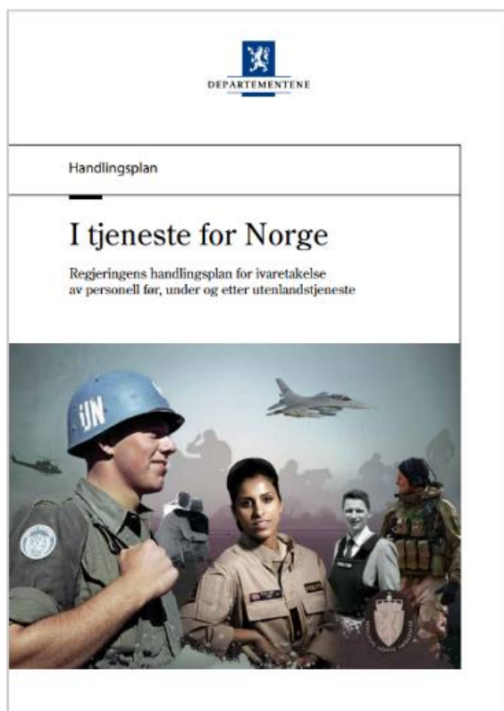
Bilde 3 Regjeringens handlingsplan

De nasjonale forventningene til veteranplanen har bakgrunn i Stortingsmelding nr. 34. Fra verneplikt til veteran . Forventningene er konkretisert og videreført i Regjeringens senere handlingsplaner. Kommunene har fått større ansvar enn tidligere og kommunene oppfordres derfor til å utarbeide egne veteranplaner.