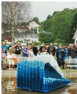
Bilde 2 Minnesmerke i Fredsparken.