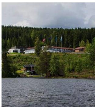
Bilde 6 Bæreia på Kongsvinger