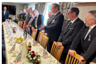
Bilde 1 Konvoibyen er sentral i anerkjennelse og ivaretagelse av krigsseilere, veteraner fra internasjonale operasjoner og deres familier. Sammenkomst i Aulaen i anledning 8. mai 2023.

Siden 1947 har over 100 000 nordmenn tjenestegjort i over 100 internasjonale operasjoner, på fire kontinenter. Av personvern hensyn har Forsvaret ikke tillatelse fra Datatilsynet til å utlevere oversikt over veteraner bosatt i Risør kommune. Forsvaret oppgir at det ifølge deres registre er ca. 60 personer bosatt i Risør som har tjenestegjort siden 1978 (UNIFIL/Sør-Libanon). I tillegg kommer de som var i Tysklandsbrigaden, i Korea, i Kongo og i Gaza. Disse har Forsvaret ikke sikker informasjon om, da registrene er uten personnummer. Antall veteraner bosatt i en kommune estimeres til kjent antall ganget med 1,5. Altså regner Forsvaret med at det er ca. 90 veteraner bosatt i Risør kommune.