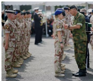
Bilde 5 Medaljer er et synlig uttrykk for Forsvarets og samfunnets heder av innsats i tjeneste for Norge.