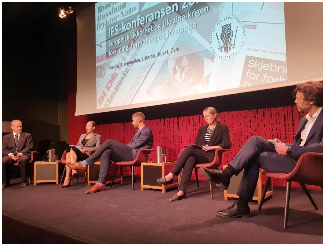
IFS-konferansen 2022 samlet ledende norske forskere, journalister og byråkrater for å diskutere de sikkerhetspolitiske utfordringene Norge og Europa står overfor, og hvordan vår forståelse av dem formes.

samfunnet mer allment. Åpne konferanser og seminarer er et sentralt virkemiddel i så måte. I 2022 avholdt instituttet, med veldig god hjelp fra FHS' sentrale stab, ni større arrangementer.