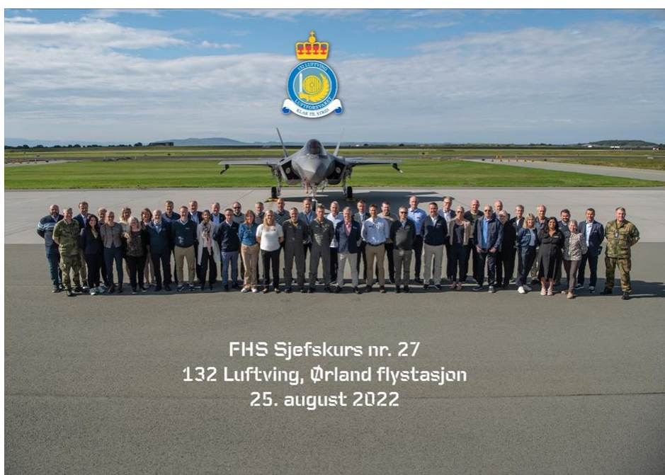
Sjefskurset på besøk til Luftforsvaret på Ørland.

innsikt i forsvars-, utenriks-, og sikkerhetspolitiske faktorer som har global og nasjonal betydning.