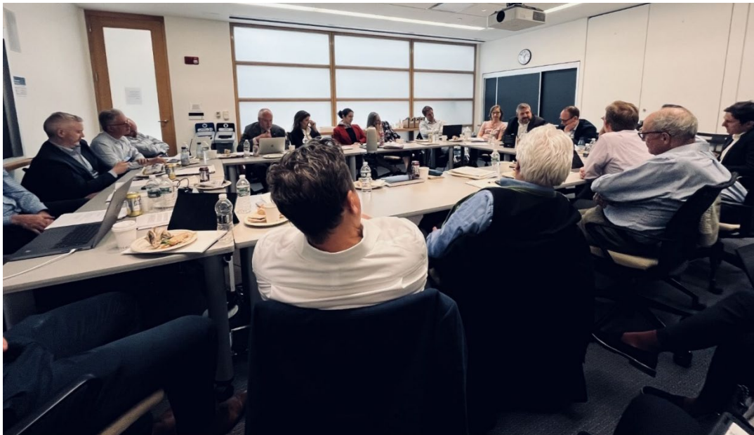
Sikkerhetspolitikk i Asia-programmet på workshop i Boston, 4.–5. mai.

Dersom tilslag på finansiering fra Forsvarsdepartementet for å forlenge programmet med ytterligere tre år, vil SPA-programmet høsten 2024 arrangere en konferanse. Der skal program-tilknyttede forskere fra blant annet Massachusetts Institute of Technology (MIT), Harvard University og Chatham House delta. Programmet var også medarrangør for Nobel-symposiet Not just another Cold War. The global implications of Sino-American rivalry , der ledende internasjonale forskere deltok, og hvor en antalogi vil bli publisert av Oxford University Press.