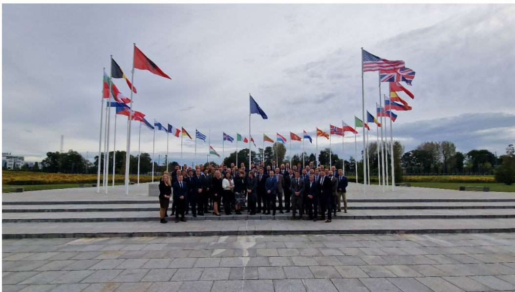
Masterstudentene og ansatte fra IFS og FHS Stabsskolen ved NATOs hovedkvarter under studieturen til Brussel i rammen av kjerneemnet Politikk og strategi, oktober.